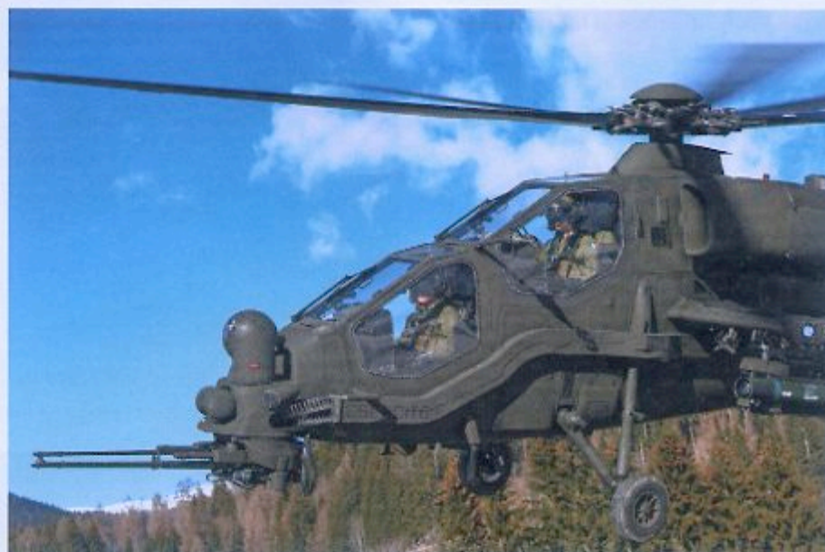
AH-129D s protikleпно vodeno raketo spike ob levem boku

Sekcijo gorske artilerije, oboroženo s havbicami M-56 kalibra 105/24 (ponovno v uporabi od leta 2016, potem ko so jih leta 2005 začasno prenehali uporabljati), so transportirali s helikopterjem CH-47F, havbice pa so bile pripete s kavlji na jeklenicah kot obesni tovor. Transportnega chinooka je spremljal par bojnih helikopterjev AH-129D. Tako so bili artilerci po prevozu na položaj nemudoma pripravljeni za obstreljevanje na določen cilj, medtem ko je združeno moštvo za ognjeno podporo (Joint Fire Support Team) koordiniralo intervencijo, v kateri sta kot podporna elementa sodelovala dva jurišnika AMX iz 51. letalskega polka Ghibli iz Istrana. Na vaji je vod avstrijske vojske predstavil večnamensko gosenično vozilo (s prikolico) za premagovanje težkih terenov BAE Systems BvS10 beowulf v imenu družbe Gorizia-na Group, ki je pred nedavnim podpisala sporazum z BAE Systems o vzdrževanju ter zastopanju vozil tega proizvajalca.