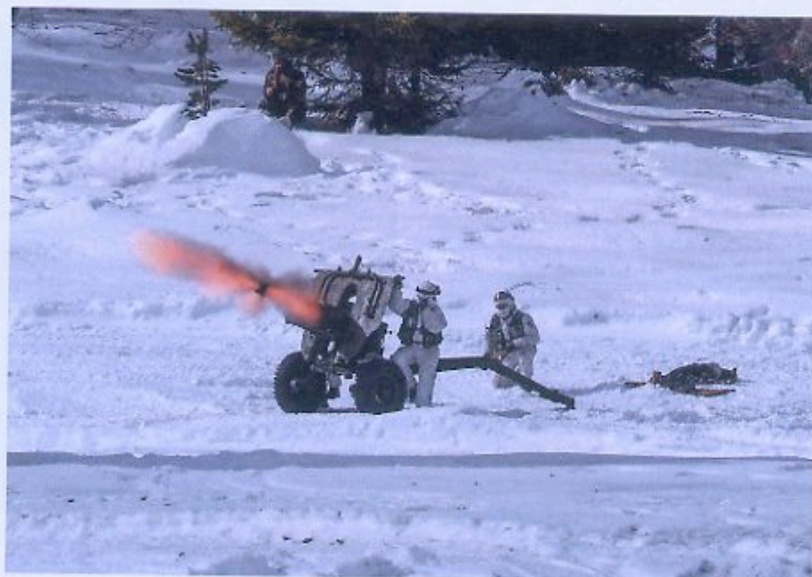
Top Melara M.59 105/41

Na terenu so se operativne skupine premikale s pomočjo snežnih vozil Bv206 S7, prekritih z zimsko maskirno prevleko, ki so jih uporabili tudi za vleko vojakov s posebno tehniko »skijoring«, ki izhaja iz Norveške. Ena izmed skupin je bila opremljena s smučmi Elan ibex tactix, ki so trenutno v procesu preizkušanja. Ta je ocenjevala uporabo smuči gleda na hitrost priprave in prostora, ki ga zavzame pri prenašanju. Sicer so se Elanove (zložljive) smuči izkazale za zelo primerne za hitro vkrcavanje in izkrcavanje iz helikopterjev in drugih terenskih vozil.