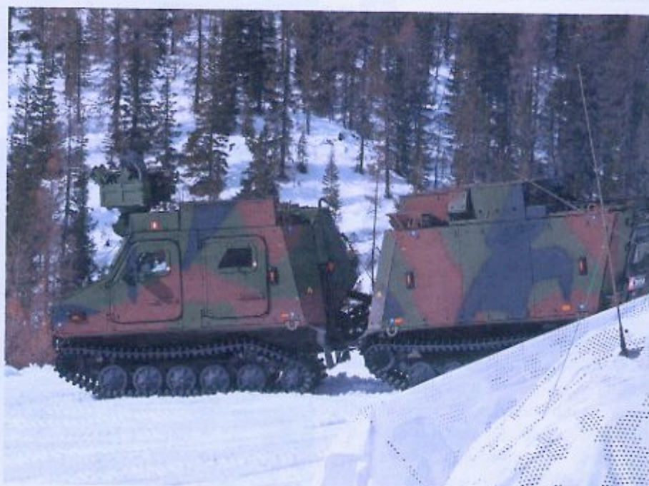
Predstavitev vozil Bv206 S10 avstrijske vojske

Osmi gorski polk alpinov, ki deluje v sestavi Gorske brigade Julija, je bil zadolžen za testiranje novih elementov na ravni brigade, da bi na podlagi tega ugotovili, kateri vod je usposobljen za reševanje in raziskovanje na gorskem terenu. V okviru 69. čete bataljona Tolmezzo sta bila v pripravljenosti dva gorska voda. Prvi kot podpora z minometi 81 mm in protitankovskim vodenim orožjem spike ter panzerfaust 3, drugi pa sekcija gorske artilerije 3. polka kopenske artilerije s havbicami 105/14, tema dvema pa so potem dodali raziskovalno patroljo Piemonte Cavalleria in moštvo ostrostrelcev na snežnih saneh. Dodatno so bile uporabljene specialne enote, kot so rangerji, ki so del 4. padalskega gorskega polka, namenska bojna skupina AVES s helikopterjem CH-47F letalskega polka kopenske vojske Antares di Viterbo, dva večnamenska helikopterja UH-205A iz letalskega polka kopenske vojske iz Bolzana in dva jurišna helikopterja AH-129D iz 5. polka letalstva kopenske vojske Rigel iz Casarse della Delizia. Sodelovala je tudi izvidniška ekipa Raven z radarjem, ki pripada 41. taktični informacijski brigadi Cordons iz Sore.