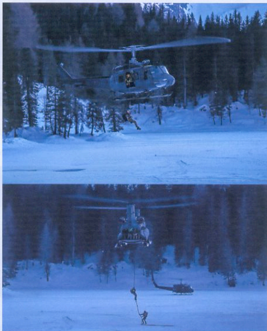
Reševalec alpinov iz helikopterja UH-205A se je spustil v ledeno mrzlo jezero, da bi rešil poškodovanca in ga s pomočjo vitla izvlekel na helikopter, medtem ko se je reševalna ekipa helikopterja CH-47 uspešno izkrcala z vravno tehniko (»fast rope«) na zaledenem jezeru.

Vaja je potekala na petih »frontah«: reševanje ranjenca iz jezera s pomočjo helikopterja, reševanje zasutih izpod snežnega plazua, reševanje treh oseb, ukleščanih v vozilo, ki ga je plaz odnesel v jezero, reševanje osebe iz vozila, na katero je padlo drevo, in izkopavanje vozila, v katerem je bil še vedno živ voznik, izpod snega. Gorske enote so v akciji uporabile številna vozila in tehnike, vse skupaj so podpirali vojaki različnih enot, sodelovali pa so še gasilci, karabinjerji, davčna policija, pripadniki italijanskega Rdečega križa, Nacionalna služba za gorsko in jamarsko reševanje in civilne zaščite združenja alpinov iz Bergertunga. V vaji so bili uporabljeni tudi helikopterji UH-205A in CH-47F italijanskega vojaškega letalstva, piloti pa so bili opremljeni z nočnogledi (NGV), ki omogočajo letenje in delovanje v nočnih razmerah.