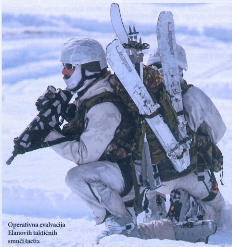
Operativna evalvacija Elanovih taktičnih smučí tactix

Alpsko vojaško prvenstvo CaSTA v svoji 71. izdaji predstavlja zimski športni in vadbeni dogodek za alpske čete italijanske vojske, ki poteka na različnih lokacijah v alpskem loku. Letos so na zasneženih tleh Misurine (Auronzo di Cadore) delovale vojaške enote iz različnih sestav italijanske vojske, kot so 8. alpini iz Brigade Julija, artilerci iz enote Piemonte Cavalleria iz Cordenonsa in 41. namenska skupina Altair iz letalstva kopenske vojske (AVES) in posebnih sil, 4. padalskega alpskega polka, v dveh ločenih vadbenih dogodkih: tehnično-taktični vaji in nočnem reševanju.