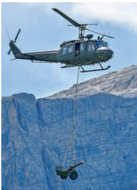
Helikopterski transport minometa 120 mm, obešenega pod transportni helikopter Agusta-Bell AB205.