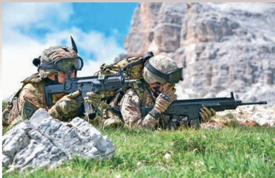
Italijanska vojaka s puškama Beretta ARX 160 – levo z modelom A2 (SF – special forces) in desno z dolgo cevjo.