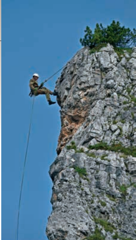
Demonstracija alpinističnih tehnik