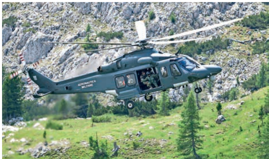
Ena najsodobnejših pridobitev italijanske vojske je Agusta - Westlandov transportni helikopter AW139 (HH139).