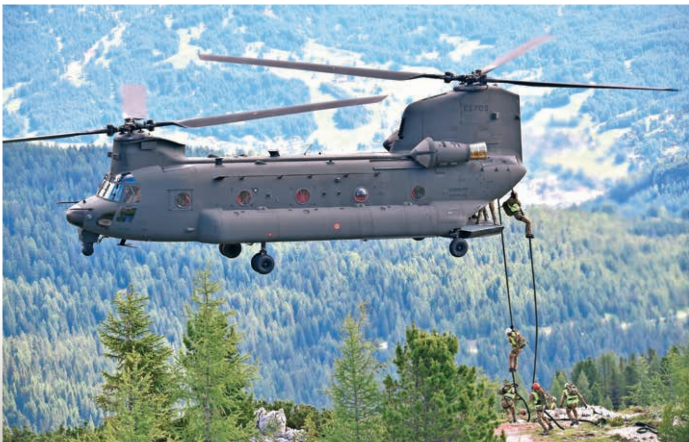
Desantiranje iz mogočnega Boeing-Agustinega transportnega helikopterja ICH-47F chinook (Italija je prva dva nadgrajena dobila pred 4 leti, skupaj jih je naročila 16) iz 1. polka Antares iz sestave letalstva italijanskih kopenskih sil.